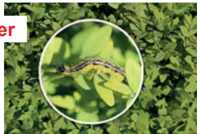
Buchsbaum Zünsler Raupe

Verschiedenste Behandlungsarten wie „Abklauben der Raupen“, Hochdruck-