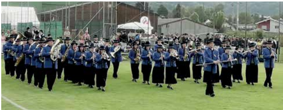
Musikverein der Siebenbürger Vorchdorf