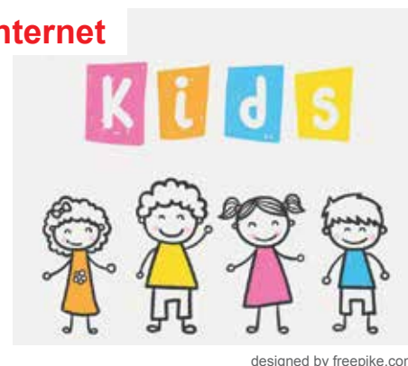
designed by freepike.com

Wenn Sie mehrere Kinder anmelden möchten, klicken Sie auf „Weiter einkaufen“.